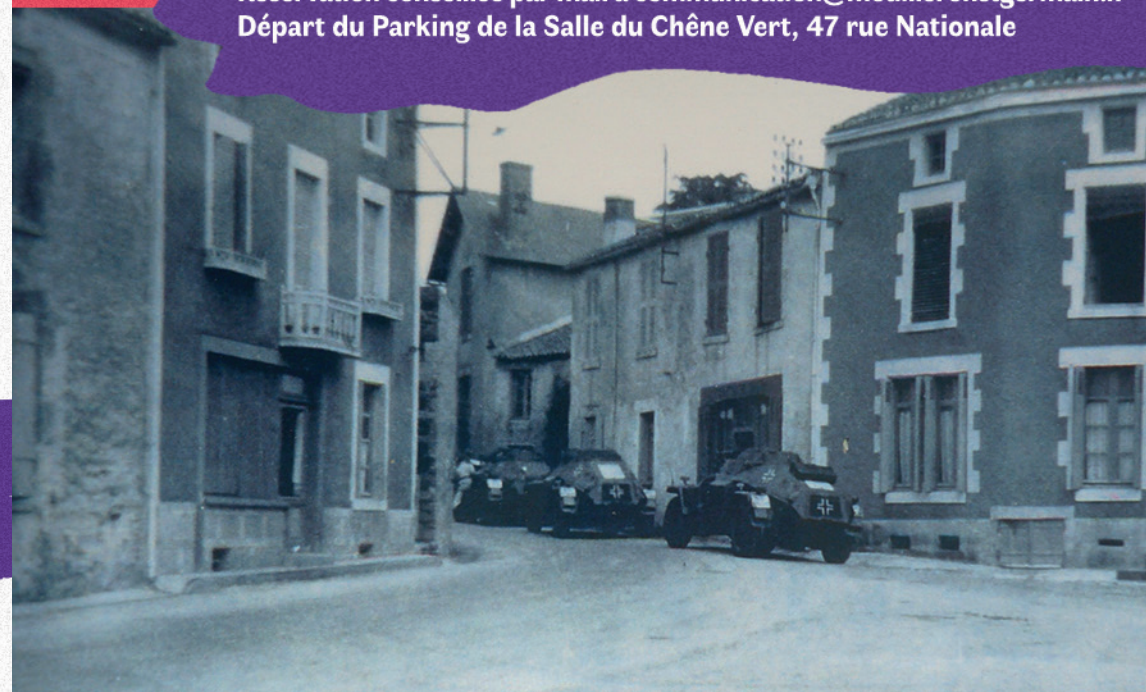
Un détachement allemand quitte Mouilleron-en-Pareds (1944)

Tout public - Gratuit Réservation conseillée par mail à communication@mouilleronstgermain.fr Départ du Parking de la Salle du Chêne Vert, 47 rue Nationale